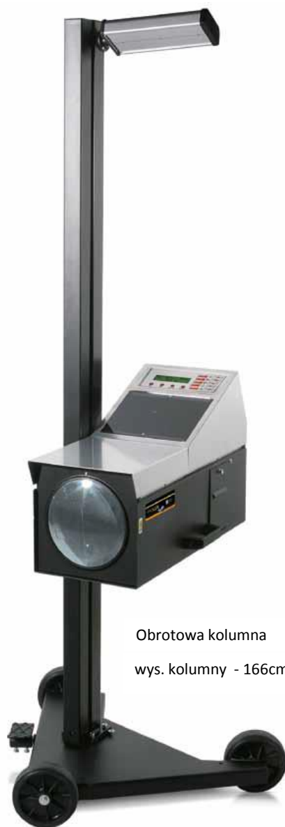
Obrotowa kolumna wys. kolumny - 166cm

Przyrząd w standardzie wyposażony jest w: