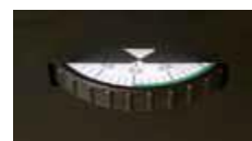
Posiada możliwość regulacji ekranu prawo/lewo za pomocą dodatkowego pokrętki