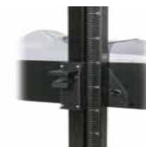
Pionowy ruch wzdłuż kolumny