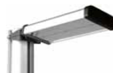
Wizjer lusterkowy do pozycjonowania urządzenia względem pojazdu

Przyrząd w standardzie wyposażony jest w: